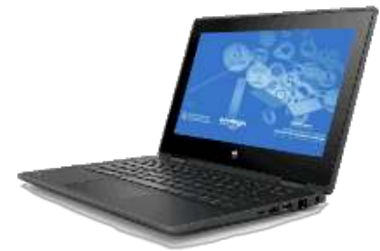
HP ProBook x360 11 G5 EE