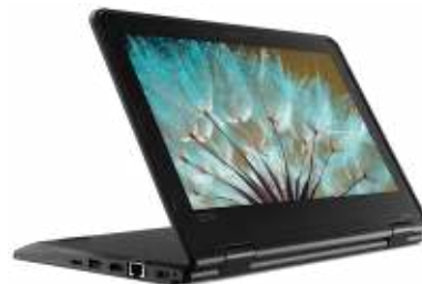
Lenovo Yoga 11e 5th Gen