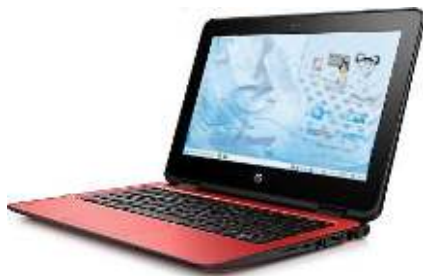
HP ProBook x360 11 G1 EE

No fogar, o/a alumno/a pode conectar o equipo a unha rede WIFI, igual que calquera outro dos seus propios dispositivos persoais.